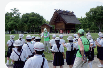
津島遺跡のガイド