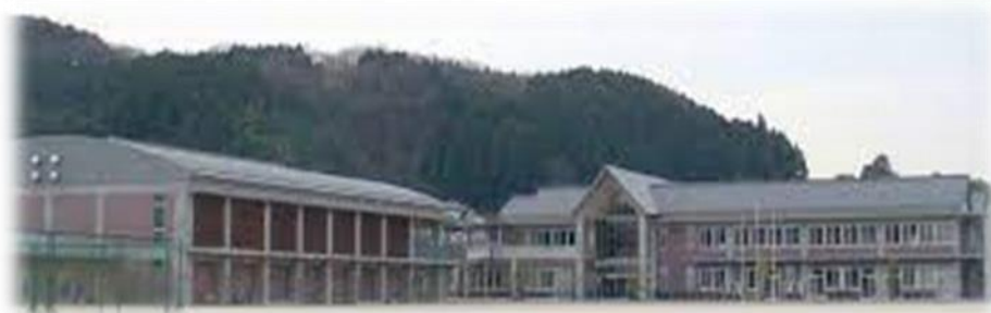
美咲町立中央中学校