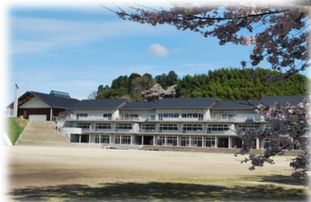
鏡野町立鏡野中学校