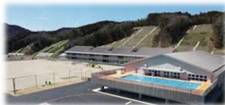
美咲町立柵原学園