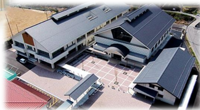
久米南町立久米南中学校