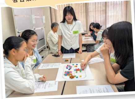
生徒が地域に住む外国人の方との交流イベントを 企画・開催(県立瀬戸高等学校)