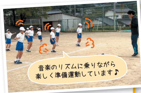
体育専科教員の体育授業の様子 (久米南町立誕生寺小学校)

また、児童生徒が体力テス トで自己記録の更新に挑戦し たり、ネット上でさまざまな 運動の記録などを競ったりす る企画やビンゴの要素を取り 入れた運動習慣カード、家庭 でも手軽にできる運動を紹介 した動画の活用などにより、 運動やスポーツをすることが好 きな児童生徒を増やす取り組 みを進めています。