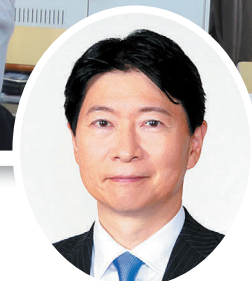
岡山県知事 伊原木 隆太

県教育委員会では教育基本法の規定に基づき「第 4 次岡山県教育振興基本計画」を策定しました。 本計画の策定に当たっては、社会情勢の変化、本県教育の現状と課題に鑑み、生涯を通じて学びを継続できるよう、学校教育や社会教育、文化、スポーツなどの教育分野全般にわたっての具体的な取り組みや目標とする指標を明らかにすることで、学校や家庭、地域、市町村と取り組みの方向を共有し、相互連携の下、着実に施策を推進してまいります。