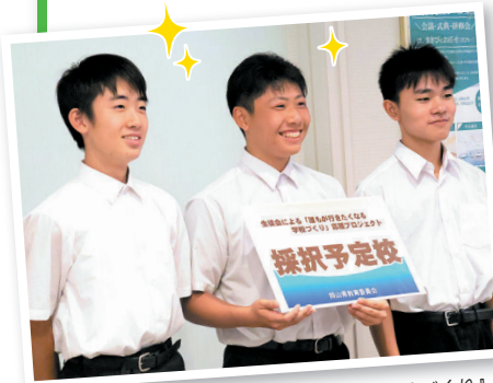
生徒会による『だれもが行きたくなくなる学校づくり』 応援プロジェクト(津山市立鶴山中学校 他4校)

児童生徒が自己肯定感や自己有用感を 高められるよう、自己の思いを実現する 場や機会の創出に取り組んでいます。 地域行事の企画、特産品を活用した商 品開発など、生徒が自ら学校や地域をよ り良くしようとする活動が県内で生ま れてきている中、今年度から、生徒会 の自主的かつ創造的なチャレンジを支 援し、達成感や有用感の育成、「夢」の 実現を後押ししています。