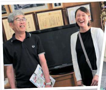
地域のボランティアの方たち (和気町立本荘小学校)