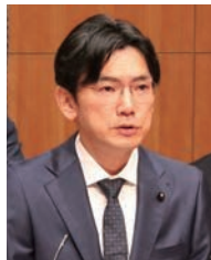
わたなべ ともひろ 渡辺 知典 議員 【自由民主党】

Q 防災庁の誘致が実現すれば、災害対応力の向上にとどまらず、企業誘致や移住定住の促進など、多方面の波及効果が期待できる。本県の優位性を発信し、他自治体との差別化を図ることが誘致の成否を左右する。災害リスクの低さや西日本エリアにおける広域連携のしやすさなどの強みを最大限に生かし、本県が最適地であることをしっかりとアピールすべきだが、誘致にどう取り組むのが所見を伺いたい。