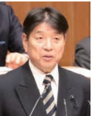
えもと きみかず 江本 公一 議員 【自由民主党】

Q フアジアーノ岡山J1残留を決め、大きな盛り上がりを見せている。新スタジアムの整備を求める署名は3か月余りで50万筆以上が集まり、県民の期待の大きさが現れたものと重く受け止めているが、署名に対する思いはどうか。また、多くの課題や様々な意見があるが、サッカースタジアムの検討を始めるべきだがいかがか、併せて伺いたい。