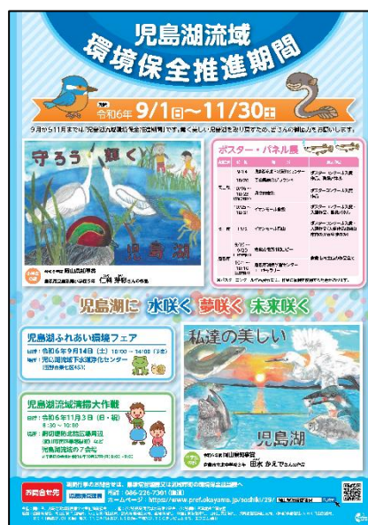
環境保全推進期間ポスター