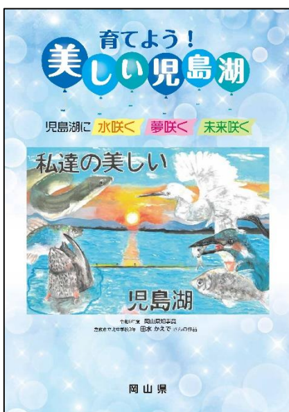
児島湖パンフレット