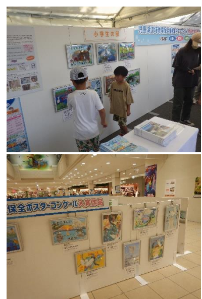
環境イベントやポスター展での展示