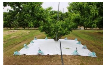
図2 部分マルチの敷設

成熟前の大雨により助長される水浸状果肉褐変症を抑制するため、主幹を中心に樹冠下4m四方に透湿性防水マルチを敷いて雨水を防ぐ部分マルチ法を開発しました（図2）。