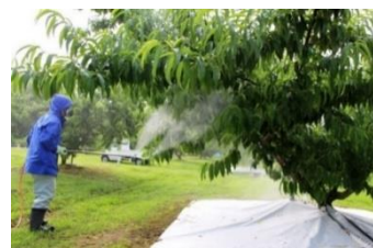
図4 エテホンの立木全面散布

成熟遅延による果肉障害の助長を回避するため、成熟促進効果のあるエテホン液剤の散布法を開発しました（図4）。