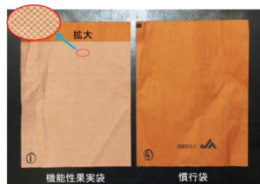
図1 開発した機能性果実袋(左)

果実温の異常昇温による赤肉症を抑制するため、慣行の果実袋に、赤外線反射機能の高い酸化チタンを塗布した機能性果実袋※を開発しました（図1）。※特許第5877441号