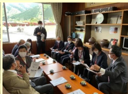
香々美小学校 第1回運営協議会 管理職、学校運営協議会委員