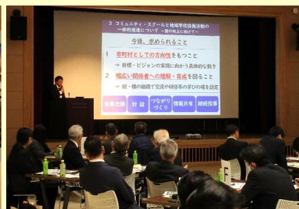
美作地区市町村教育委員連絡協議会 秋季研修会 教育長、教育委員