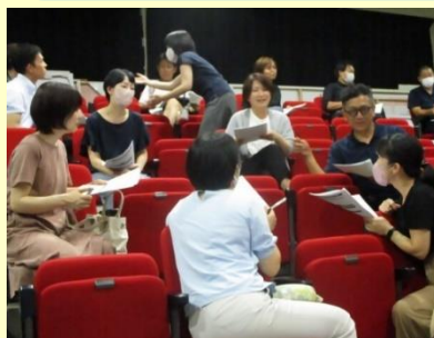
勝田中学校区 PTA研修会 幼小中学校教職員、PTA、地域住民