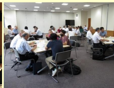
真庭市学校運営協議会連絡会 学校運営協議会会長

コミュニティ・スクールと地域学校協働活動の 一体的推進を目指して～「質の向上」に向けて～