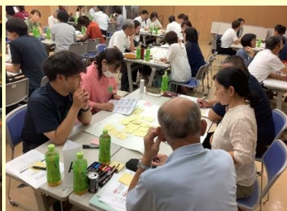
蒜山中学校区 CS合同研修会 学校運営協議会委員、教職員、地域住民