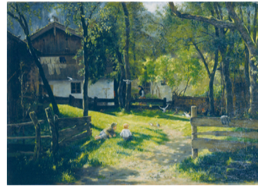
1886年 岡田直次郎「風景」 岡山県立美術館蔵