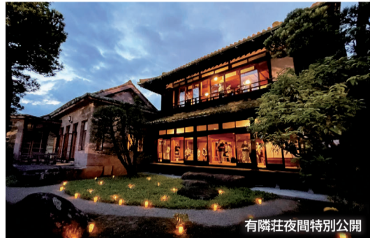
※画像はすべてイメージです。