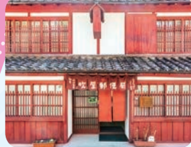
吹屋ふるさと村 (高梁市)