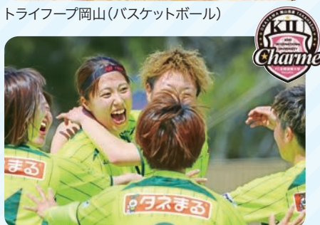
吉備国際大学charme岡山高梁(サッカー)