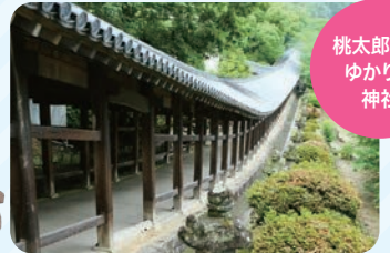
吉備津神社(岡山市)<日本遺産>