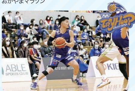
トライフーブ岡山(バスケットボール)