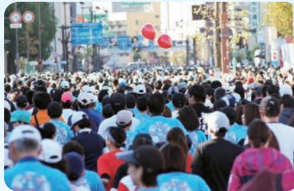
おかやまマラソン