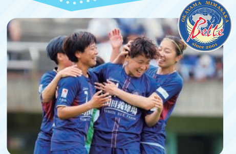
岡山湯郷Belle(サッカー)