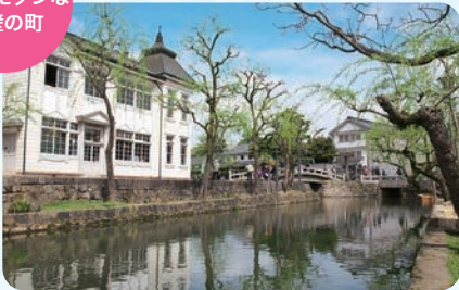
倉敷美観地区(倉敷市)