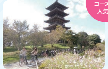
備中国分寺(総社市)