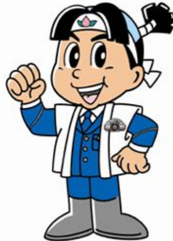
おかやまけんけい ももくん