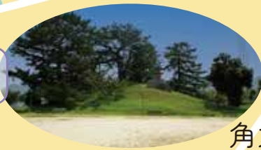
墳頂の黒松は樹齢450年！