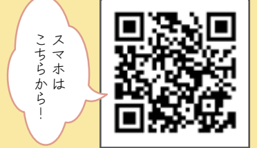
スマホはこちらから！