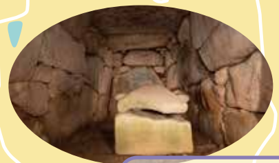
全国最大級の規模を誇る横穴式石室で、吉備三大巨石墳の1つ！通常は施錠されていますが、中に入れる日も...