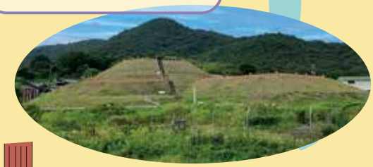
吉備最古の横穴式石室を見学！墳頂からは造山と塚が並び立つ全景が広がる。