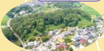
全国第10位の規模！ありのままの墳丘へ登れる！