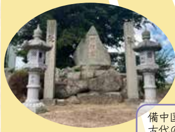
備中国における古代の政治拠点。