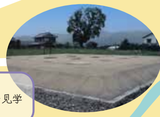
古代の寺院跡。整備された塔跡を見学できる！