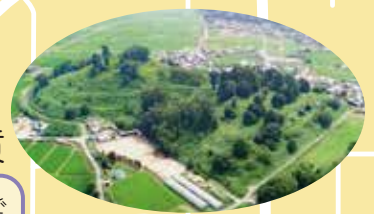
歩いて登れる古墳で全国第1位の規模！前方部頂上では石棺を間近で観察！