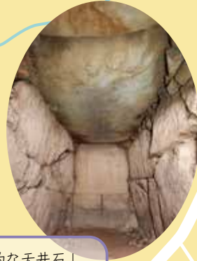
圧倒的な天井石！岡山大学によって調査中。