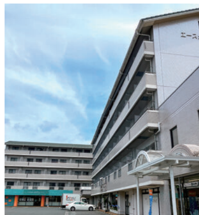
※写真はエースタウン中村(外観)です