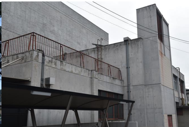
井原市民会館別館外観