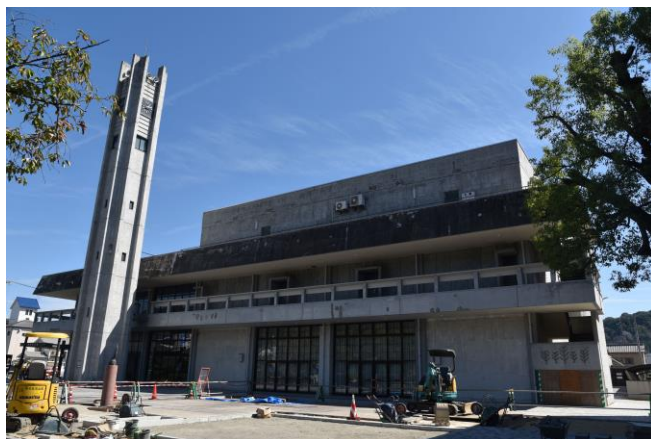
井原市民会館本館外観