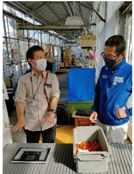
収穫量自動集計秤の開発コンソーシアム (R3年度～R4年度)