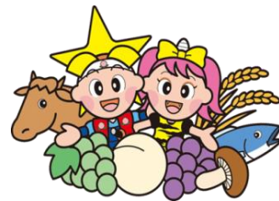
岡山県マスコット ももっち、うらっち