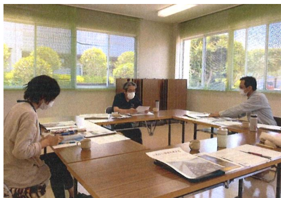
月1回行われる公民館長会議

館長同士が集い、学び合う場をもつ ことで、これからの公民館活動の充実につなげている好事例です。