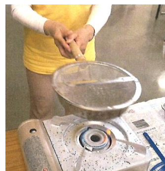
好みの状態まで焙煎

地域には、スキルをもった人材が多くおられるかと思えます。ニーズに応えるだけでなく、 人材を活かすという視点からも 、講座づくりを考えていくことが大切ですね。