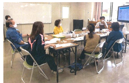
コーヒーの基礎から学びました