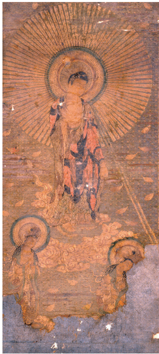
岡山県指定重要文化財 刺繍阿彌陀三尊来迎図 久米南町 誕生寺