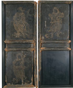
重要文化財 四天王図鎧金給屏 山口市 龍蔵寺