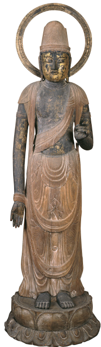
重要文化財 聖観音菩薩立像 瀬戸内市 餘慶寺