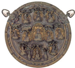
山王本地仏懸仏 安来市 清水寺