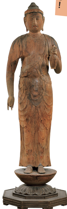
重要文化財 十一面観音立像 三朝町 三佛寺