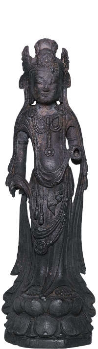
重要文化財 観音菩薩立像 大山町 大山寺