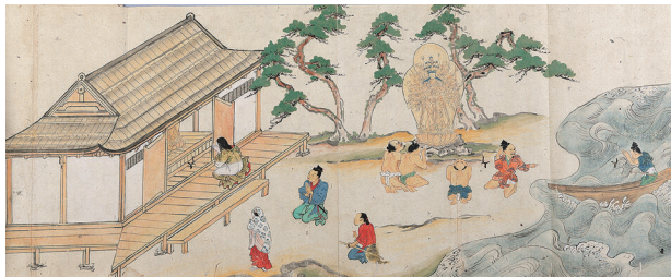
岡山県指定重要文化財 金陵山古本縁起(部分) 岡山市 西大寺