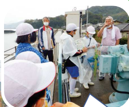
水門の管理について 聞いている様子