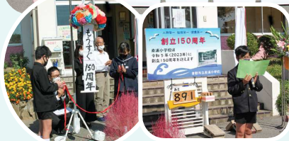
カウントダウン看板除幕式(2020.10)