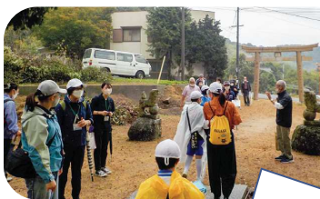
高潮の際の避難場所の一つ「七神社」