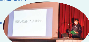
学習発表「南浦小学校 150年の歴史をたずねて」