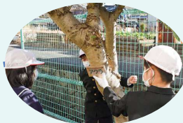
樹木名プレートの設置