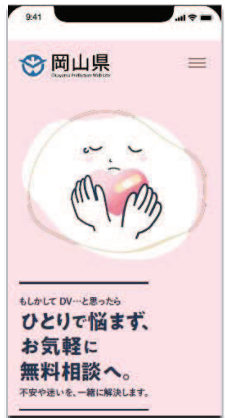
DVセルフチェックHP画面