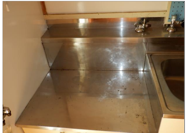
ガスコンロ置き場