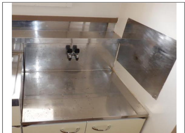
ガスコンロ置き場