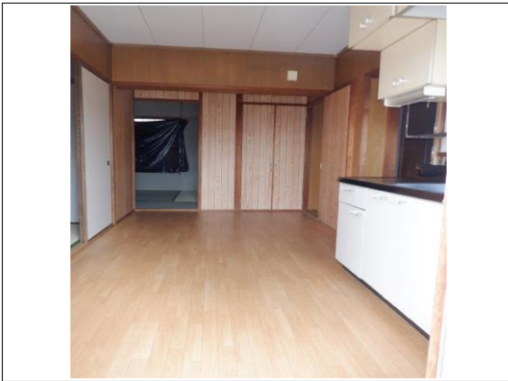
DK (バルコニー→和室側の角度)