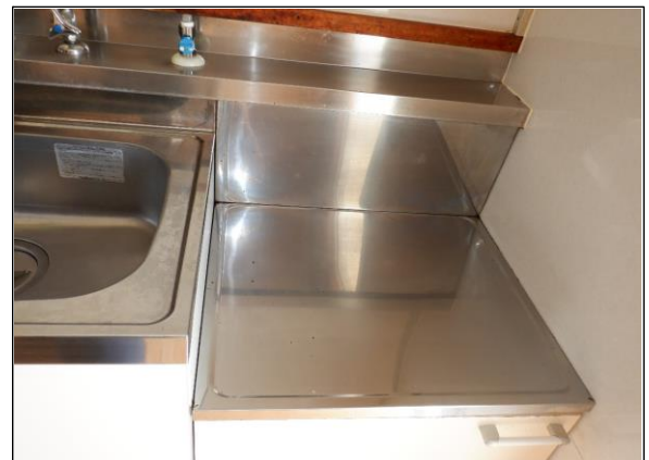
ガスコンロ置き場