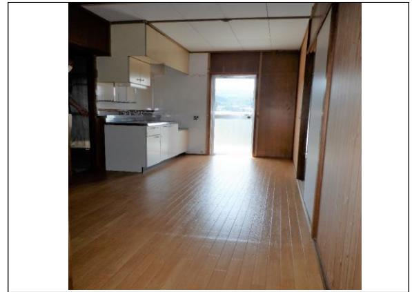
DK (和室→バルコニー側の角度)