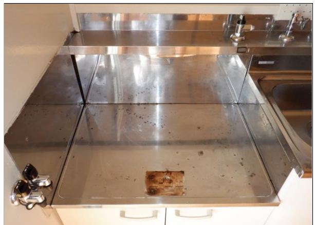
ガスコンロ置き場