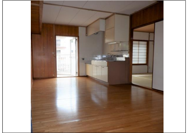
DK (和室→バルコニー側の角度)