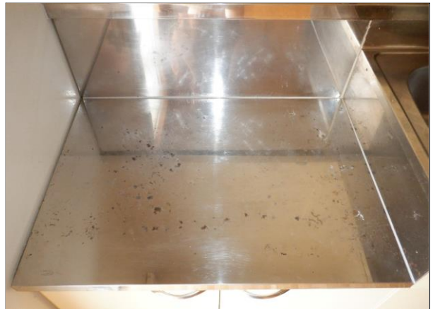
ガスコンロ置き場