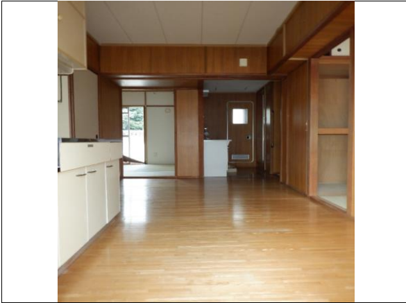
DK (バルコニー→和室側の角度)