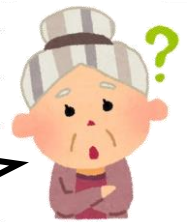
元学校評議員さん