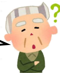
学校支援ボランティアさん

コミュニティ・スクールとは、「 学校運営協議会 」を設置している学校のことです。