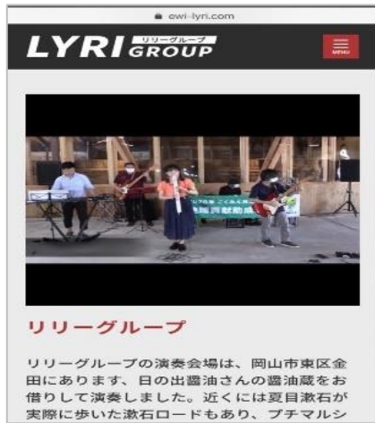
【リリーグループ(配信画面から)】