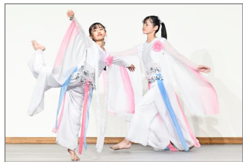
【岡山県現代舞踊連盟】