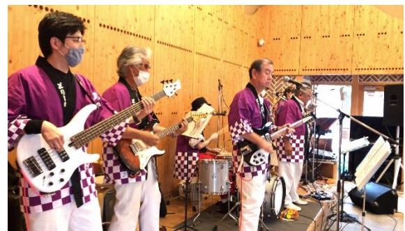
【矢掛まちあるき文化祭】