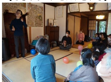
【手話に学ぶ身体表現】