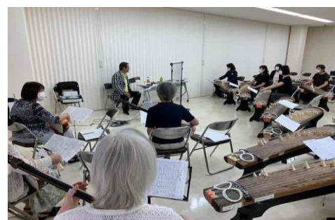
【 箏曲アカデミー岡山 】