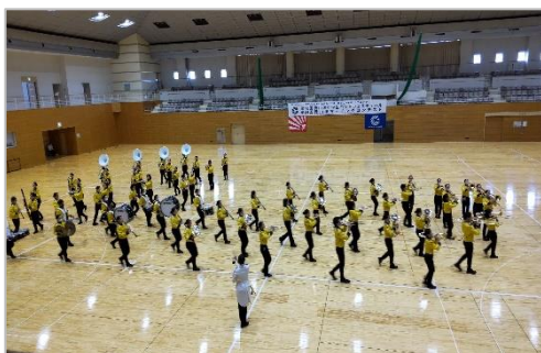
【岡山県吹奏楽連盟】