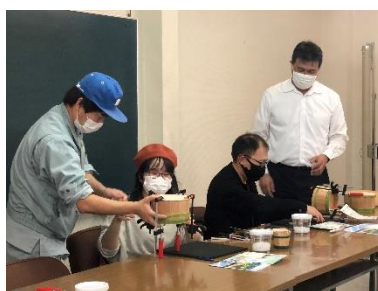
【桶樽の技術で間伐材を楽器に！】