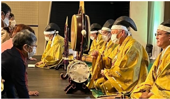
【音楽でつなぐ世界の和】