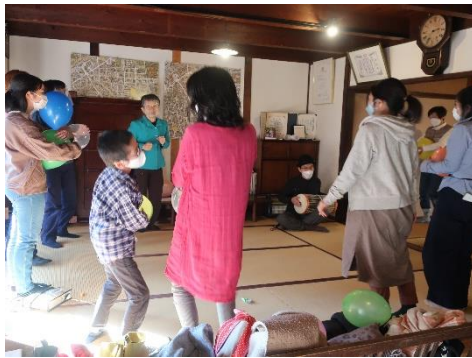
【NPO 法人企画 on 岡山】