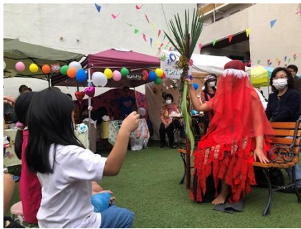
【株ありがとうファーム】