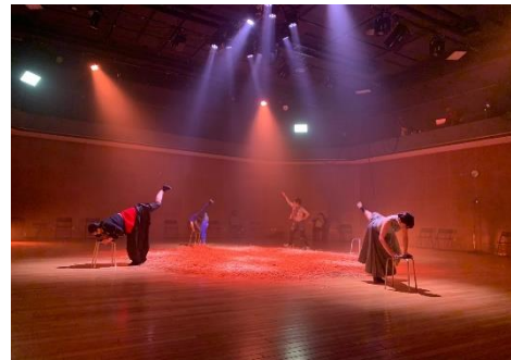
【M. A. P】