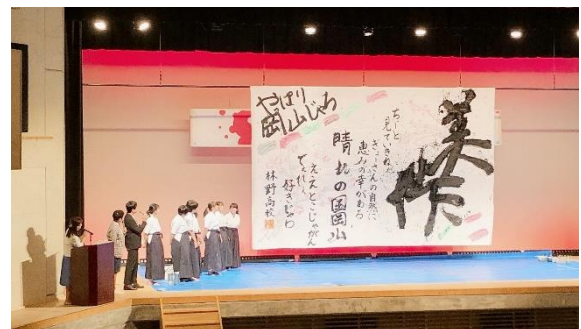
【 We Love「地元」 】