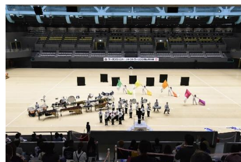
【岡山県マーチングバンド協会】