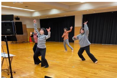
【岡山県女子体育連盟】