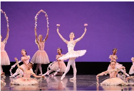
【岡山県バレエ連盟】