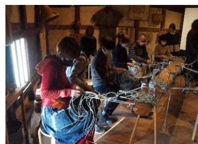
【倉敷いぐさの瓶かごづくり】