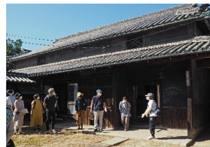
【(玉島)円通寺西側の集落】