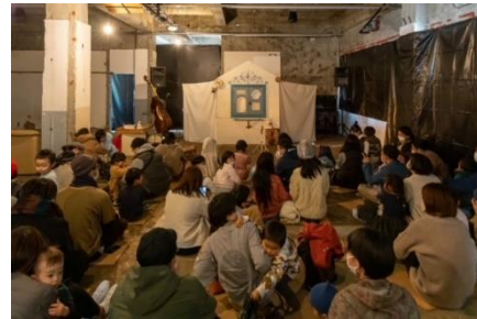
【 音楽劇の鑑賞 】