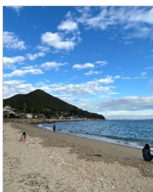
【ちきゅうの声とたわむれる】