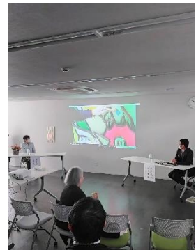
【 展覧会 】