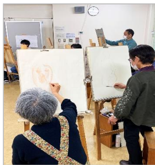
【岡山県美術家協会】