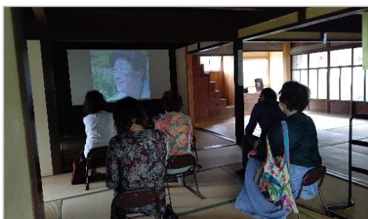
【 永瀬清子生家保存会 】