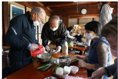
【まちのすきまカフェ 2021～アートデリバリー～】