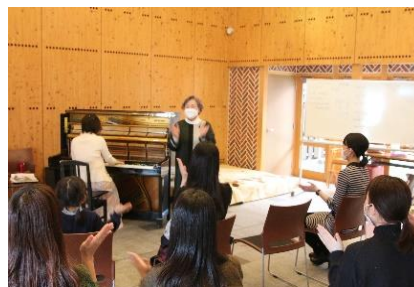
【音楽のアウトリーチ】