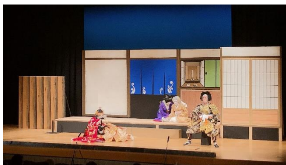
【 THE TRADITION～伝統芸能祭～ 】