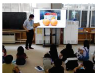
観光課の方による説明

社会科の授業で真庭市役所の観光課からゲストティーチャーを招いて地域の魅力を学習。