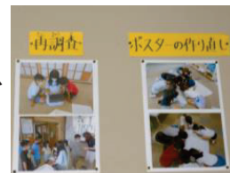
教室に学びの足跡を掲示