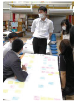
本年度の校内研修で共有