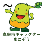
真庭市キャラクター まにぞう

「ゆるキャラ」はその土地の特産物や大切にしているものをモチーフにしていることを学習。