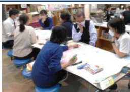
校内研修「②単元を構想」