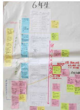
前年度に作成した単元計画と教科の関わりを見直し

そこで、教師は子どもたちの活動状況や思いによってその都度年間指導計画を見直し、子どもたちの反応や求めに応じて 柔軟に修正 することでよりよい学びを生み出していきます。「主体的に探究する子どもの育成」には、探究の過程で子どもたちに失敗があってもよい、 当初の想定と違っていてもよいという教師の構えが重要 と考えています。