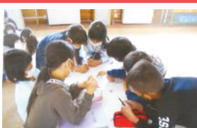
R3年度5年生 学習の様子

「②単元を構想」では、単元名（※合言葉として児童と設定する）に加え、関連的な指導を通して育成したい資質・能力を明記して「習得」と「活用」を意識した学習活動の展開につないでいく。