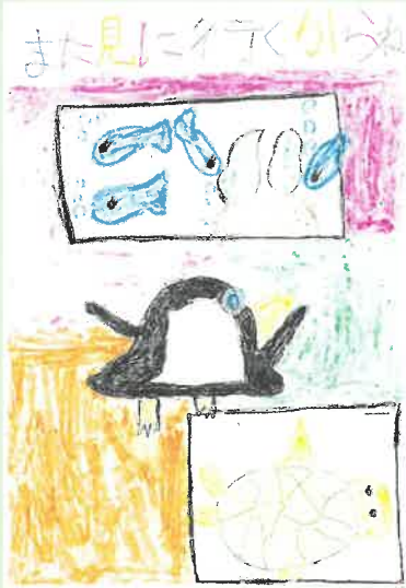
ペンネーム...あみみん