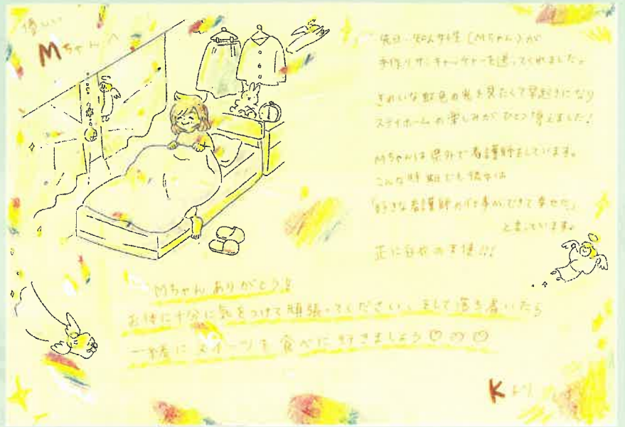
ペンネーム: Kちゃん

心臓手術して9年、集中治療室で多くの方々に夫の命を助けて頂き、今になって夫の命をありがとうに言えます。心から感謝しながらコロナを乗り越えたいですネ