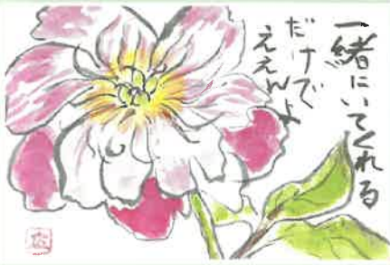
ペンネーム: ヒロチャン

心臓手術して9年、集中治療室で多くの方々に夫の命を助けて頂き、今になって夫の命をありがとうに言えます。心から感謝しながらコロナを乗り越えたいですネ