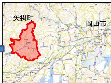
国土地理院地図を編集して作成