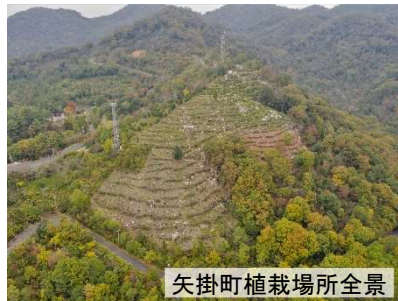
矢掛町植栽場所全景