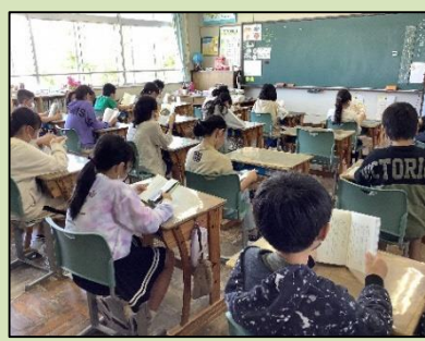
休み時間の図書室の様子

昼休みが終わった13時15分から13時30分の15分間は、毎日読書タイムです。学校全体が静かな雰囲気の中、読書に取り組んでいます。