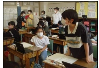
【「見合う授業」の様子】

湊城西小学校では、研究主任が提案授業を行うことで授業研究のモデルを示し、全教員で研究の方向性を共通理解します。また、「見合う授業シート」を活用し、無理なく時間を効率的に使って授業研究を行う工夫がなされています。