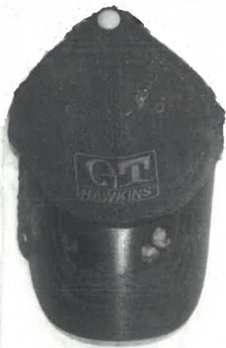
黒色キャップ帽(一部画像処理済み)