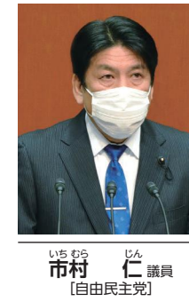
市村 仁 議員 【自由民主党】