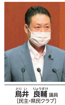
鳥井 良輔 議員 【民主・県民クラブ】