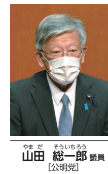
山田 総一郎 議員 【公明党】

◆ 地域交通を活用した観光振興策について ◆ 地域交通を活用した観光振興策について