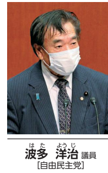
波多 洋治 議員 【自由民主党】