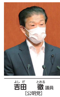
吉田 徹 議員 【公明党】