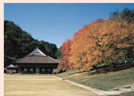
◎旧閑谷学校講堂と楷の木

これからの紅葉シーズンのおすすめは、旧閑谷学校です。国宝の講堂の横にある楷(かい)の木は、毎年鮮やかに色づきます。講堂以外にも多数の文化財がありますので、紅葉を楽しみながら散策してみたいはいかがでしょうか。