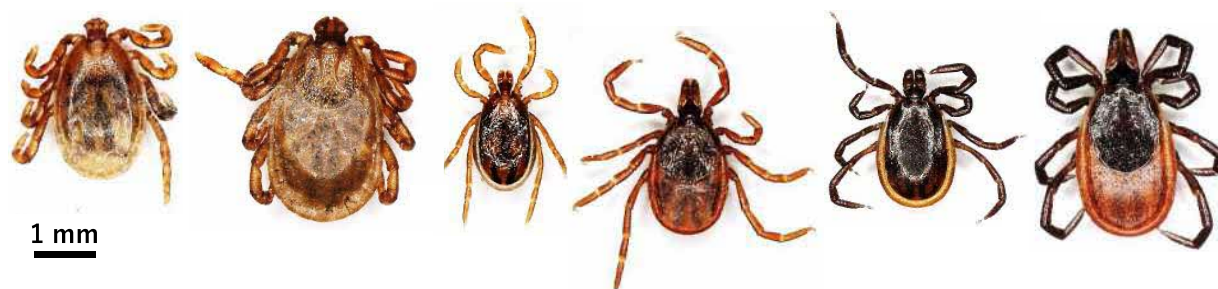
図 1. 北海道内でよく見られるマダニ (左から順に、オオトゲチマダニのオス、メス、ヤマトマダニのオス、メス、シュルツェマダニのオス、メス。特にヤマトマダニ、シュルツェマダニが人を刺すと言われている)