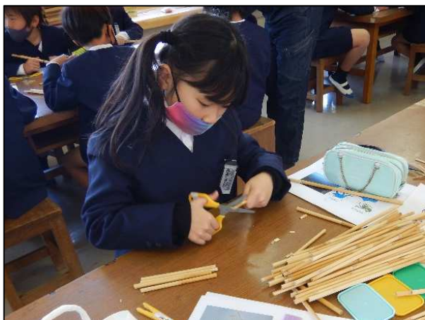
〈ヨシの工作を行う児童〉