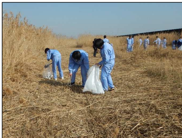
<散乱したゴミの回収>