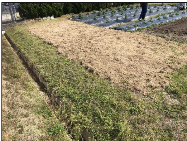
<マルチング材として再利用>