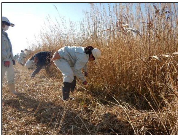
<ヨシ刈り体験を行う興陽高校の皆さん>