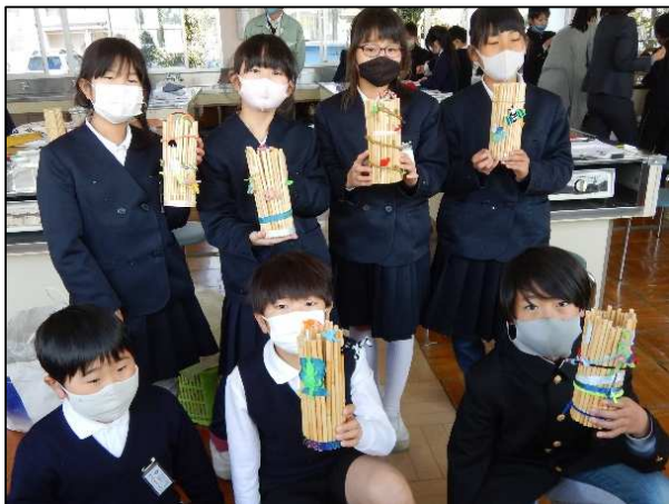
〈花瓶を制作した児童の皆さん〉