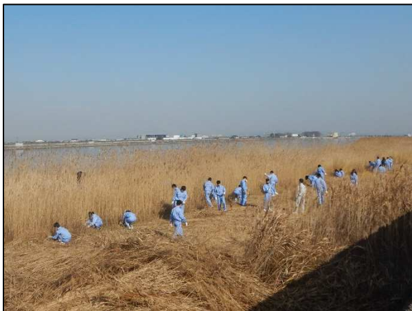
<ヨシ刈り体験を行う津山工業高校の皆さん>