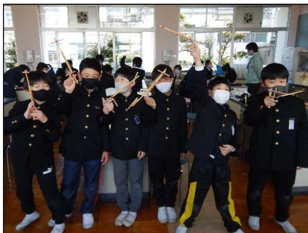
〈ゴム鉄砲を制作した児童の皆さん〉