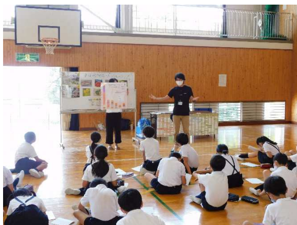
<環境学習出前講座>