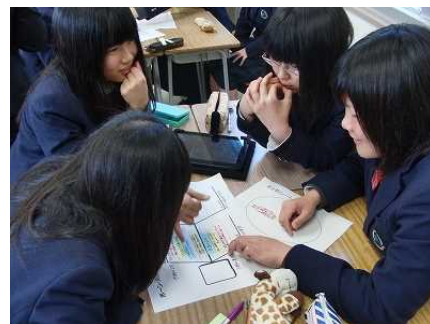
図3 授業実践の様子