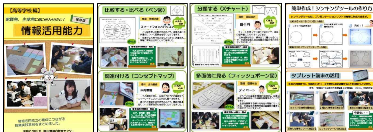
図4 開発したリーフレット（一部）

『教育のIT化に向けた環境整備4か年計画』（2014、文部科学省）によると、平成29年度までに、可動式コンピュータを学校に40台設置することが目標とされている 7) 。協力委員の授業実践では、タブレット端末を活用し、情報を幅広く収集したり、多様な手段で収集した情報について協議、検証したりする活動を取り入れていた。生徒が情報を共有したり、思考ツールを活用したりする主体的な学習を支援するために有効なツールとして、タブレット端末の利用が期待されることから、活用事例を掲載した。