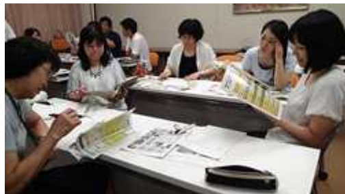
図5 校内研修の様子