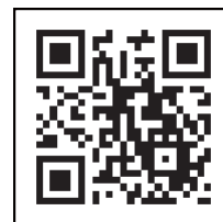
「コロナワクチンナビ」 二次元コード