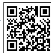
「共通予約システム」 二次元コード