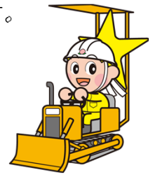
岡山県マスコット ももっち

平素より美作岡山道路の建設推進にご理解とご協力を賜り厚く御礼申し上げます。 本号では、現在工事中の英田IC（仮称）～湯郷温泉IC間の状況をご紹介します。