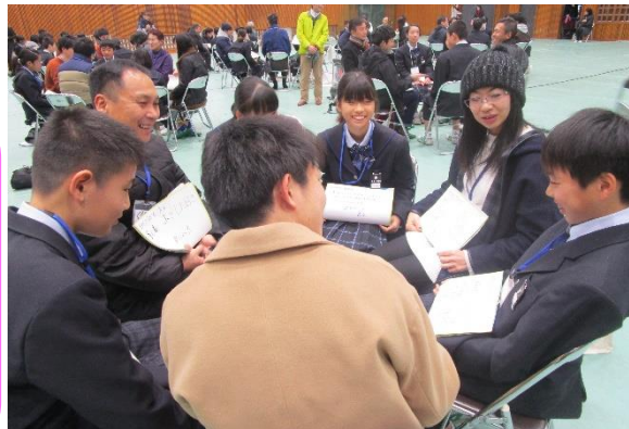
中学生だっぴ～大人と生き方を語り合う

小中学校には、全ての特別支援学級に支援員を配置、業務アシスタントやALT、情報教育支援員も配置。小学校には専科英語教員、小1グッド支援員、登校支援員、高学年は教科担任制を一部導入。中学校には心の教室支援員、 全ての部活動に部活動指導員 を配置し、教材研究や児童生徒と触れ合う時間の確保に努めています。