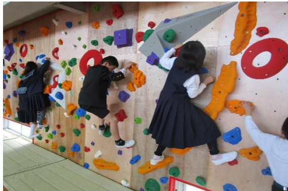
小学校にボルダリング～楽しく体幹を鍛える

「早島町学校教育ビジョン」のもと、「地域とつながり未来を拓く早島っ子」の育成に向けて、「自立・共生・郷土早島を愛する心」を基盤として、15歳の春を見据え、保幼小中の教職員が一体となった取組を進めています。ESDとキャリア教育の視点を踏まえたカリキュラムなど、社会に開かれた特色ある教育課程で子どもたち一人一人の笑顔が輝いています。小中一貫教育を基盤に、「喜んで登校・満足して下校、行きたい・行かせたい学校園」を目指し、協働・協学・協育の町づくりを進めています。