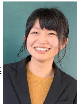
早島町立早島小学校 教諭

子ども達が見せる「できなかったことができるようになった時の表情」それは、何物にも代え難いものがあります。皆さんも私たちと一緒にそんな瞬間に立ち会ってみませんか。早島は夢の宝島。皆さんの若い力と笑顔が子ども達の夢や志をはぐくみます。