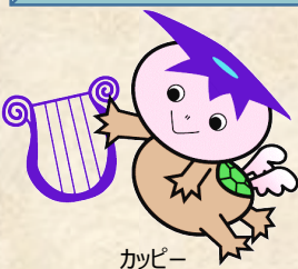
カッピー 久米南町マスコットキャラクター