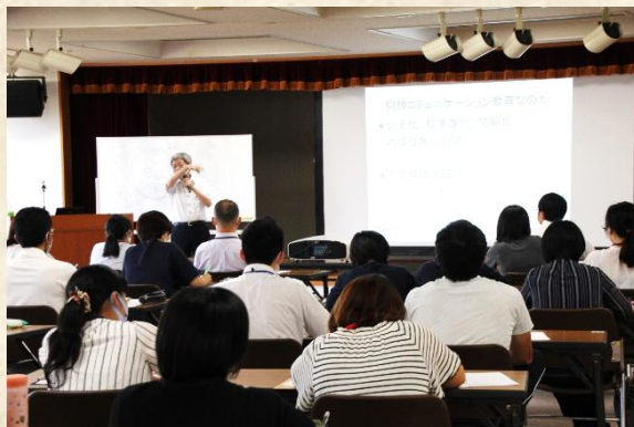
幼小中教職員による研修会

また、演劇的手法を取り入れた「コミュニケーション教育」に取り組んでいます。多様な価値観に触れることにより他者理解の力を育てたり、自分を表現することにより自尊心を高めたりすることを目指しています。