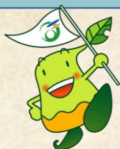
真庭市観光キャラクター 「まにぞう」

[基礎データ] 人口: 42,679人 学校数・児童生徒数: 小学校 20校・2,077人 中学校 6校・1,108人 (令和2年5月時点)