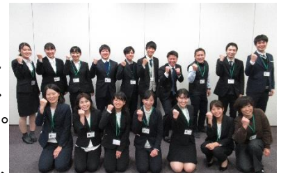
令和2年度採用 真庭市立小・中学校 初任者一同

みなさん、ぜひこの真庭で、子どもたちと一緒に育ちあい、豊かな時間を過ごしましょう!