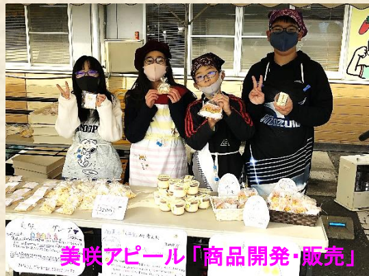
美咲アピール「商品開発・販売」

コミュニティ・スクールを推進し、社会に開かれた教育課程、地域と共にある学校づくりを目指しています。