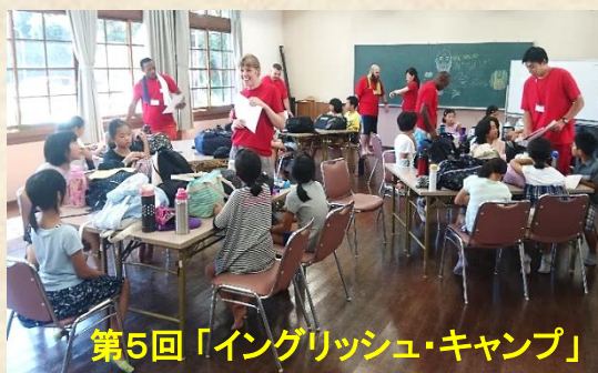
第5回「イングリッシュ・キャンプ」