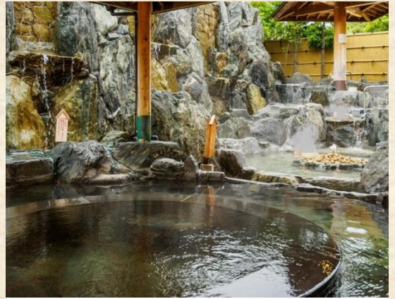
スポーツといで湯の街美作

美作市では、すべての子どもたちの自立を目指して、幼稚園・こども園・保育園から中学校卒業までの15年間を見据えた中学校区連携教育を推進し、家庭・地域と連携し子どもたちの豊かな心と確かな学力を育む取り組みを進めています。また、誰にとってもわかりやすい授業づくりによるインクルーシブ教育を推進しています。