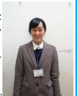
美作市立英田中学校 教諭