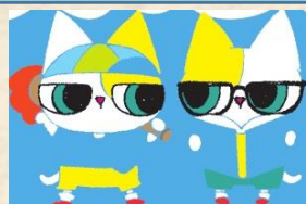
ろんご村の 双子の猫ちゃん

【基礎データ】 人口：32,602人 学校数・児童生徒数： 小学校10校・1,267人 中学校5校・648人 (令和2年5月時点)