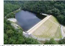
(防災重点ため池の安全対策の実施)