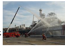
(水島コンビナート防災訓練)