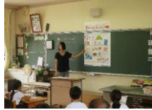
(防災ワークシートを活用した授業)