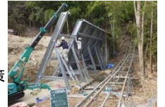
(治山施設の補修・機能強化)