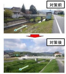
(河川改修による河道拡幅)