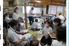
(地域の課題を洗い出すワークショップ)