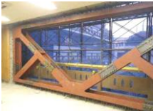
(鉄骨ブレースによる耐震補強)