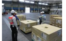
(物資オペレーション訓練)