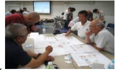
(災害ボランティア・コーディネーター研修会)