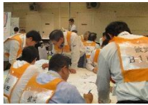
(災害廃棄物対策図上訓練)