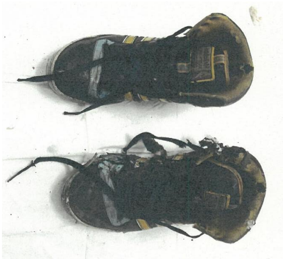
黒地に黄色と水色のライン入り運動靴(27~28cm)