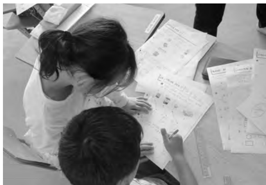
下の学年の児童に教える姿