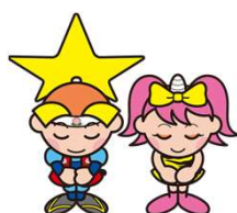
岡山県マスコット ももっち・うらっち